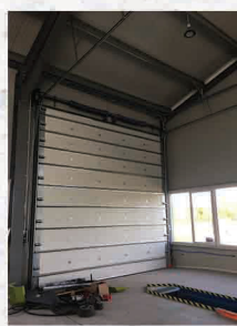
Szeged Auto szervíz