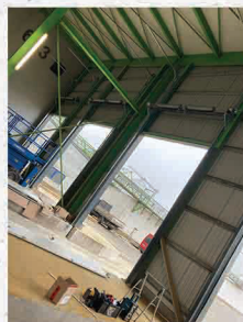
Tisztafüspök Kall Ingerents Kft.