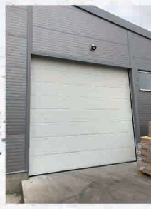
Kaposszekcső Caadex Kft.