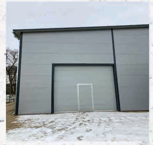
Herend VFP-Systems Kft.