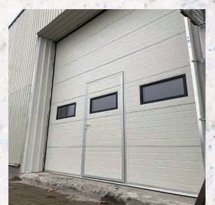
Taksony Szilor Kft.