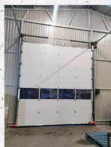
Kiskunlac. Mató Kft.